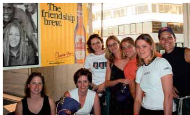
Onder: GROOT GLIMLAGTE Almal geniet die samekoms.

V anjaar se Castle Lager Koviese-Alumni se Londen-reunie op 12 Julie tydens die Ukkasie-kunsteffes by die Wembley-stadion was 'n reuse-sukses!