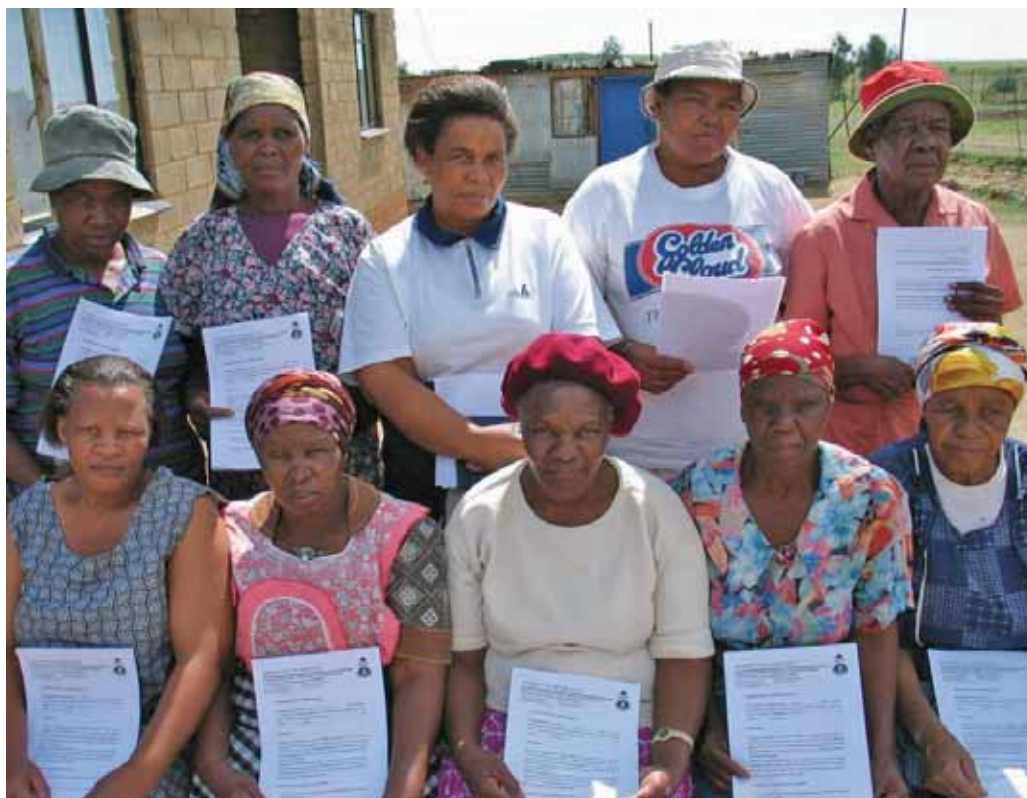
Deelnemers aan die projek ontvang hulle kontrakte van die universiteit.