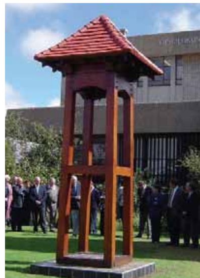
BOK se klok.

Oud-studente word aangemoedig om die uitstaande versameling skilderye wat deur die jare deur die BOK byeengebring is, in die Johannes Stegmann-kunsgalery in die UV-Sasolbiblioteek, te besigtig.