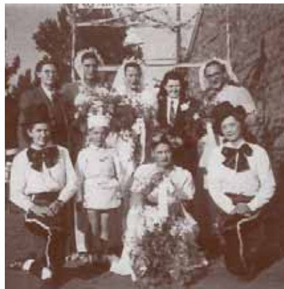
Jool 1941: Agterstevoor bruihof wat eerste prys gekry het.

Kan julle glo dat dames net toegelaat was om ontbyt sonder sykouse by te woon, maar sykouse was verpligtend vir ander maaltye, klas toe en as jy saans uitgegaan het!