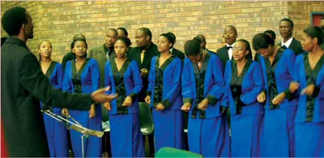
The University of the Free State Qwaqwa Choral is turning 21 this year. During the official opening of the choir, new leadership was elected and was urged to carry forward the achievements of the choir.