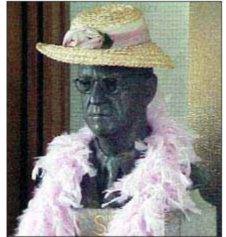
CR Swart sal 'n ogie hou oor die koffiedrinkery in die Java Hut in die CR Swartgebou.

beskikbaar in Huis Koos en Huis Emily Hobhouse. Besprekings kan gedoen word by die kaartjieskantoor op die Thakanengbrug.