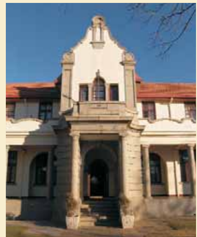
Huis Abraham Fischer.