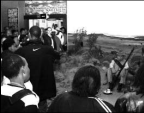
Besoek aan die Oorlogsmuseum.