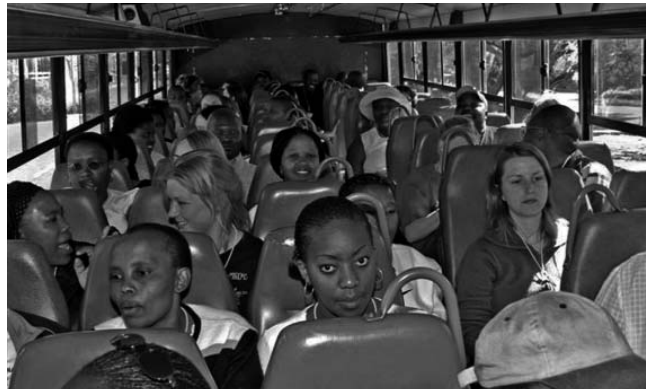
Studente van die Fakulteit Geesteswetenskappe op pad na die Oorlogsmuseum. Op die kultuurdag het hulle ook ’n draai gery deur die geskiedkundige President Brandstraat waarna hul die swart woonbuurte van Batho, Bochabela, Phahameng, Pelindaba en Kagisanong besoek het.

“Suid-Afrika is ’n land van swart mense en wit mense. Ons kan nie ware Suid-Afrikaners wees as ons nie begrip vir mekaar het nie. Kulturele interaksie is noodsaaklik.”