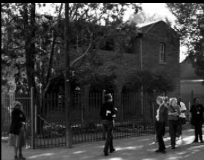
Mapikela-huis waar ANC-stigterslede ontmoet het.