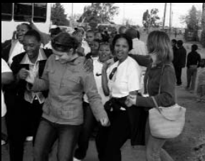
Toe die bus breek, was dit net die regte geleentheid om 'n paar danspassies aan te leer.