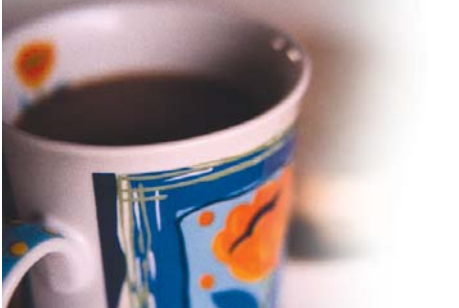
Dot Wilken 'Verdra mekaar en bly positief'