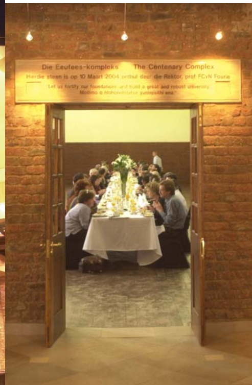
At the opening of the Centenary Complex.