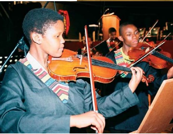
The Botshabelo String Quartet playing at the open-air honorary doctorate ceremony.