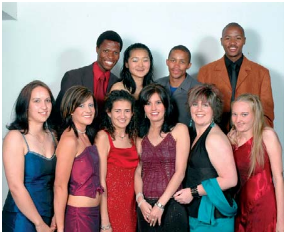
Die uitgaande bestuur van die Juridiese Vereniging tydens die Dinee van die Vereniging gehou op 26 Augustus 2006.